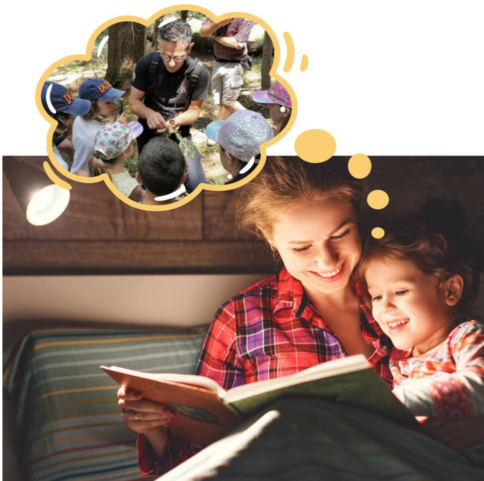
Una bambina rivive l'esperienza vissuta in vacanza grazie al racconto di una favola con esperienze simili.

Ecco che, anche una bella favola della buona notte , può creare sensazioni di ricordo uniche. E ancor di più se il contenuto è personalizzato a tal punto da far rivivere ai bambini che ascoltano la favola e ai genitori che la leggono, esperienze già vissute nel tuo hotel. Non una storia letta e riletta, ma una storia originale fatta di personaggi della tua animazione , ambienti del tuo hotel , scenari della tua destinazione , coinvolgendo la mascotte , se ne hai una. La nostra idea innovativa è proprio questa: creare favole inventate per i bambini che raccontino l'esperienza di vacanza nel tuo family hotel .