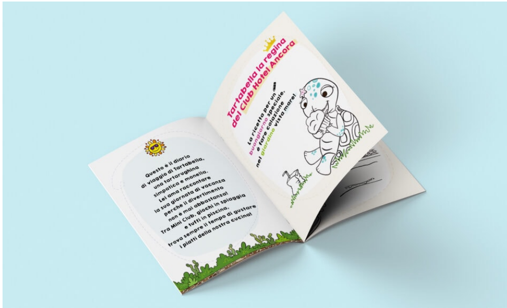
Leggi e colora di Tartabella, UNAHOTELS Club Hotel Ancora di Stintino