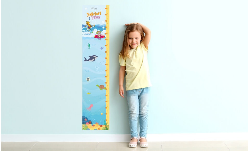
Il metro di Jack&Tippy, Family Hotel La Baia di Diano Marina