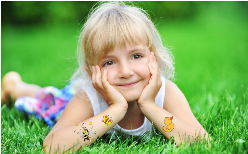
Tatuaggi dell'Ape Gaia, Alpino Baby Family di Andalo