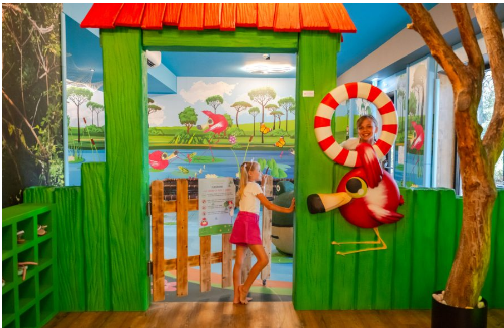
Ludoteca la Laguna di Mery&Diana, Meridiana Family&Nature Hotel di Marina Romea