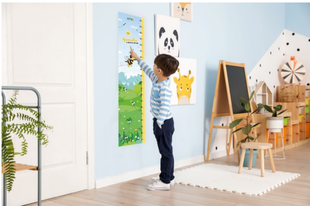
Apometro dell'Ape Gaia, Alpino Baby Family di Andalo