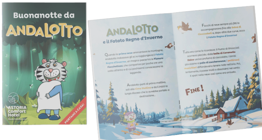
Favole della buonanotte di Andalotto, Astoria Comfort Hotel di Andalo