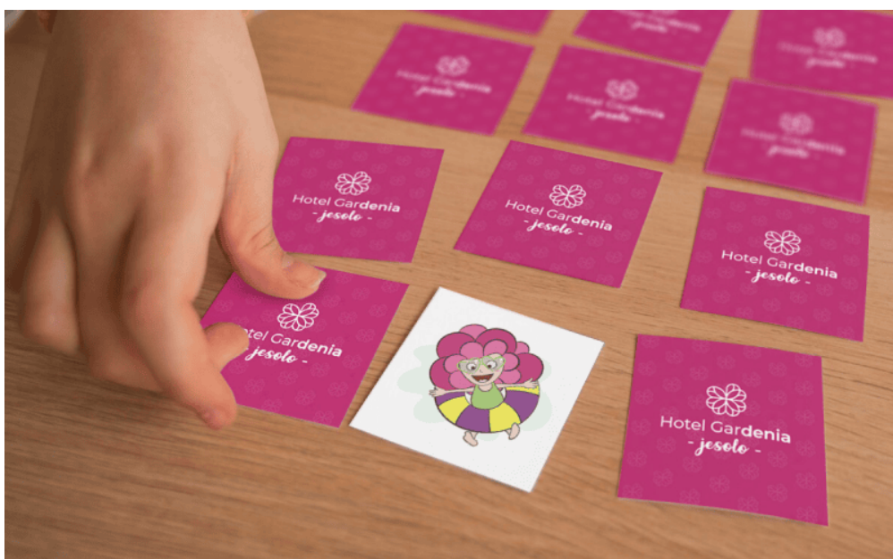
Memory di Denia, Family Hotel Gardenia di Jesolo