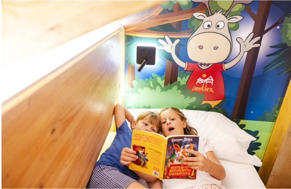
Camera a tema La Tana di Biz, Ambiez Family&Wellness Hotel di Andalo