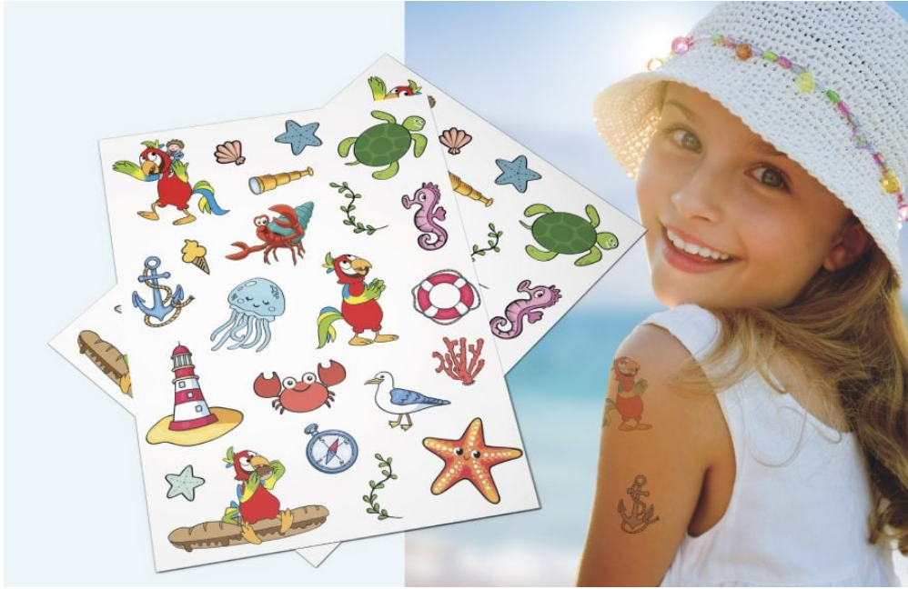
Tatuaggi di Pimpy, Imperial Family Beach di Marotta