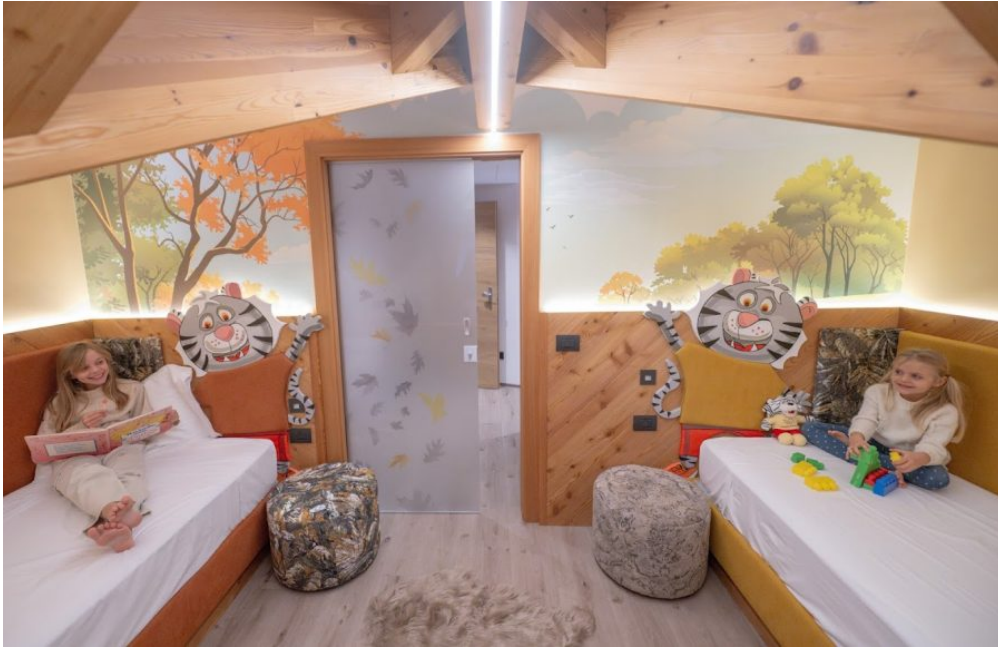
Camera a tema Andalotto, Astoria Comfort Hotel di Andalo