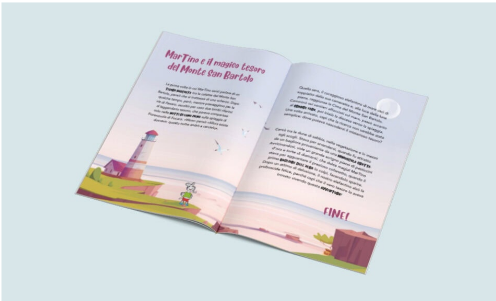
Favole della buonanotte di MarTino, UNAHOTELS Imperial Sport Hotel di Pesaro