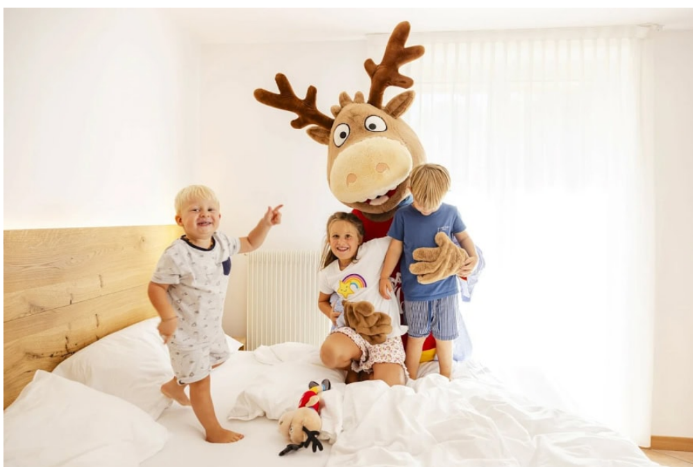
Ciao sono Biz, la mascotte dell'Ambiez Family&Wellness Hotel di Andalo!